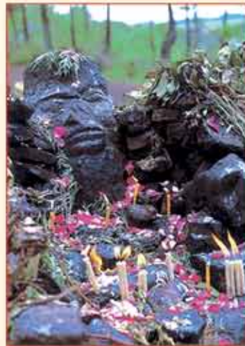
As oferendas são sinais de devoção.

As oferendas são feitas para pedir saúde e sucesso. Rezam diariamente e gostam da prece comunitária com danças e cânticos. São bastante criativos e espontâneos, pois não gostam da formalidade. As fórmulas e orações escritas importam muito pouco para os africanos que se deixam empolgar pelo dinamismo e eficácia dos seus ritos.