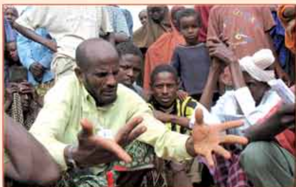
As religiosidades africanas são essencialmente comunitária.