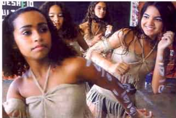
A diversidade cultural enriquece a Nação.

A violência dessas ações, onde a intimidação é o propósito maior, materializa-se pelo uso do armamento pesado e pela forma arrogante de como se dirigem aos sacerdotes dessas religiões. Digo, ainda, que é preciso aprofundar a busca pela instituição da garantia dos direitos constitucionais, com base na Igualdade e Equidade. Por certo, nunca se viu e, tomara que não se veja, um templo católico sendo invadido, ameaçado ou fechado, naqueles períodos consagrados, do dia quando os sinos dobram.